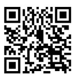
SYARAT KHAS MENGIKUTI FAKULTI

SILA IMBAS KOD QR UNTUK LIHAT KADAR YURAN DAN SYARAT KHAS PROGRAM