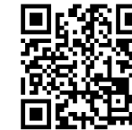
SYARAT KHAS MENGIKUTI FAKULTI

SILA IMBAS KOD QR UNTUK LIHAT KADAR YURAN DAN SYARAT KHAS PROGRAM