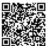
KADAR YURAN PENGAJIAN